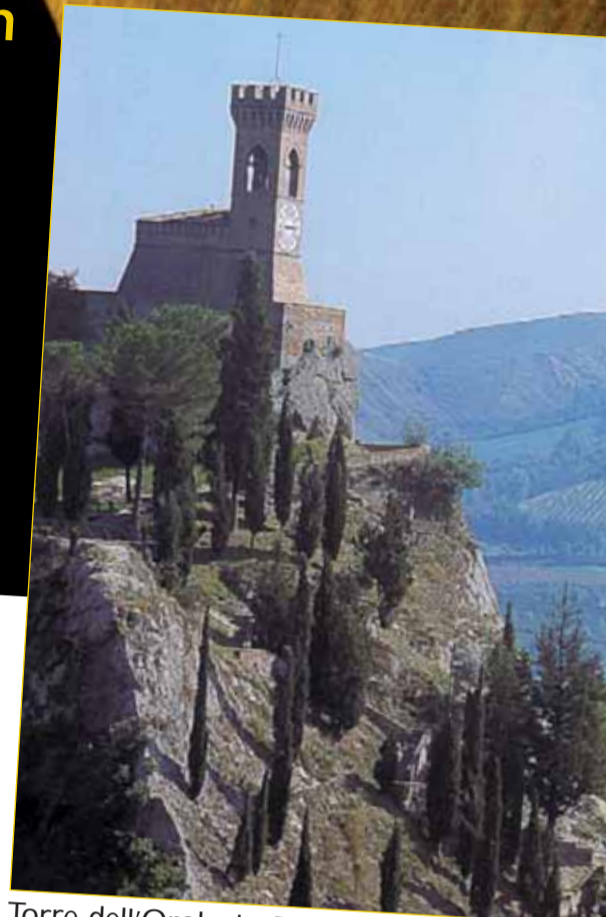
Torre dell'Orologio, Brisighella

Centro Aterosclerosi "GC Descovich" Dip. di Medicina Clinica e Biotecnologia Applicata "D. Campanacci" Università di Bologna Policlinico Sant'Orsola Malpighi